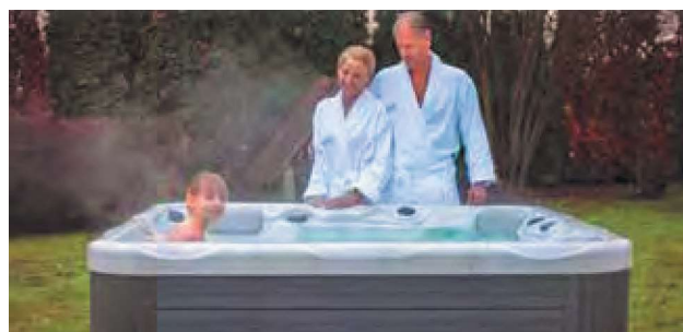
WEH-860-0018 Spa PLUTO