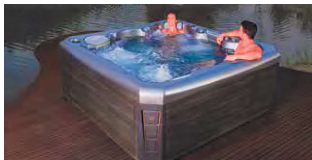
WEH-860-0087 Spa MAGALA STANDARD