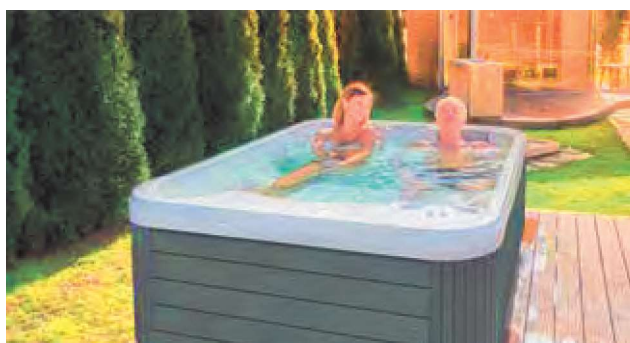
WEH-860-0072 Spa WE 330/2L