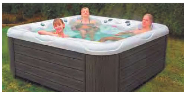
WEH-860-0001 Spa VENUS