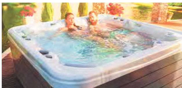
WEH-860-0009 Spa WE 645L