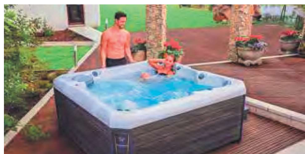
WEH-860-0086 Spa MARBELLA STANDARD