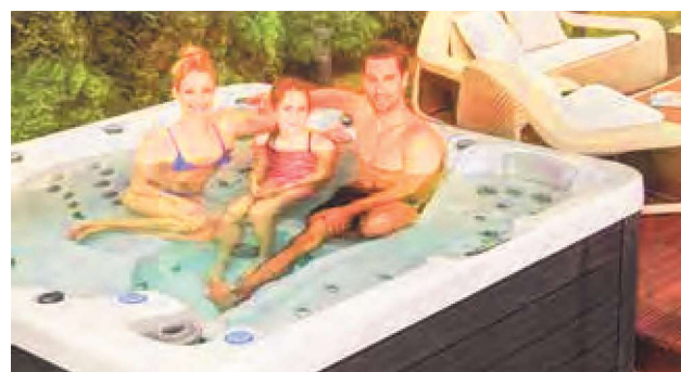
WEH-860-0074 Spa WE 536L