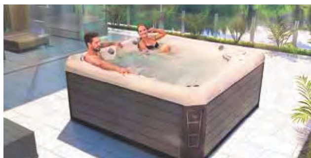
WEH-860-0033 Spa PALERMO