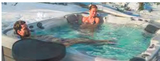
WEH-860-0017 Spa KILIMANJARO