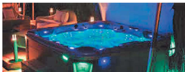
WEH-860-0004 Spa EVEREST